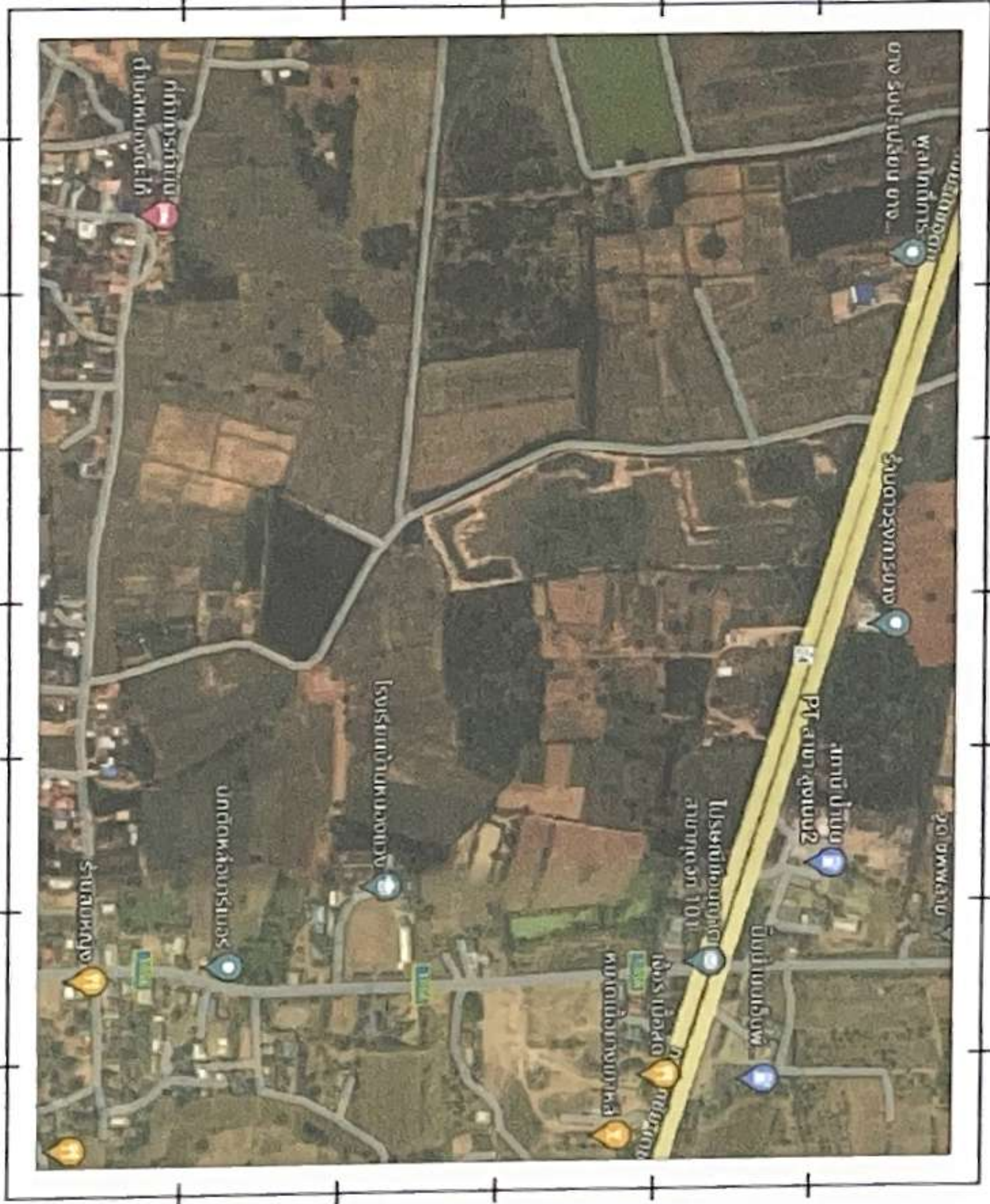
แผนที่โดยสังเขป